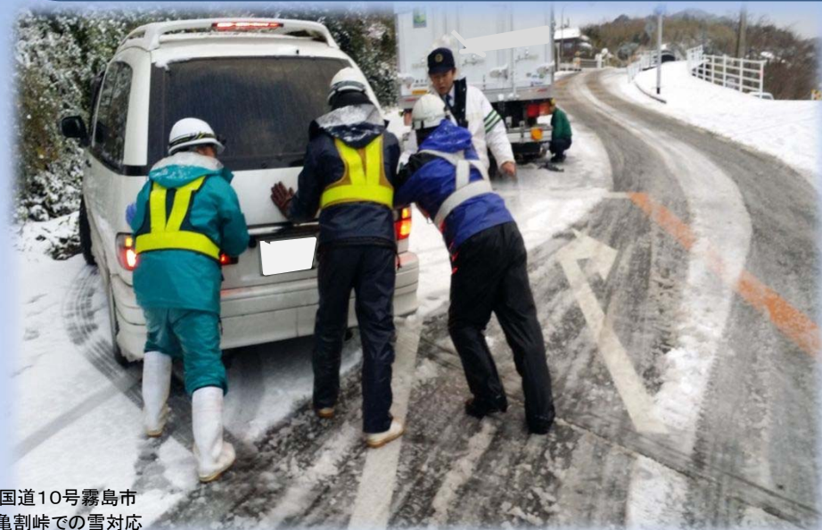
国道10号霧島市 亀割峠での雪対応