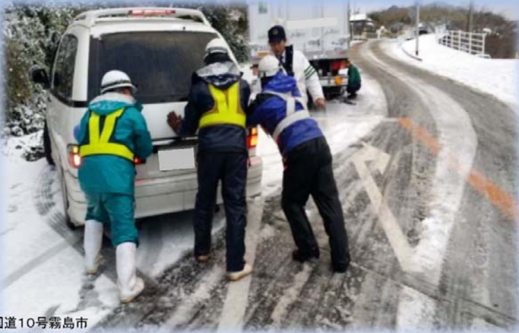
国道10号霧島市 亀割峠での雪対応