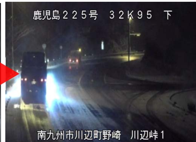
融雪剤散布・ダンプ走行後