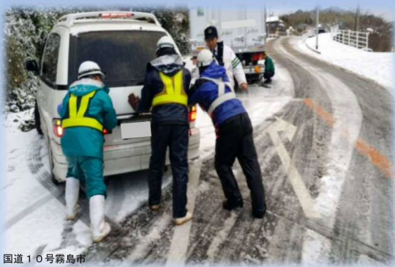
国道10号霧島市 亀割峠での雪対応