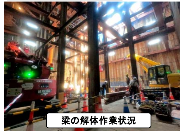
梁の解体作業状況