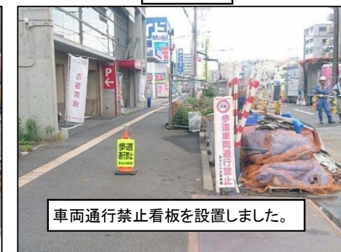
車両通行禁止看板を設置しました。