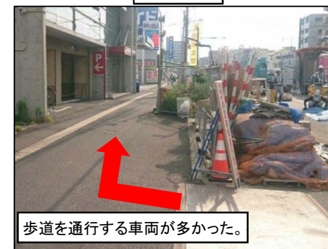
歩道を通行する車両が多かった。