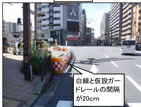
仮設ガードレール設置位置の修正