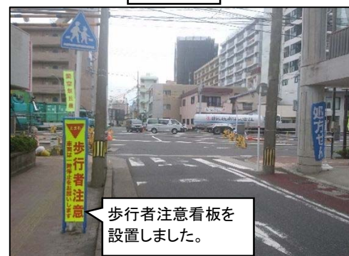
歩行者対策(注意喚起看板の設置)