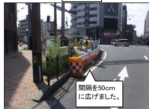
間隔を50cmに広げました。