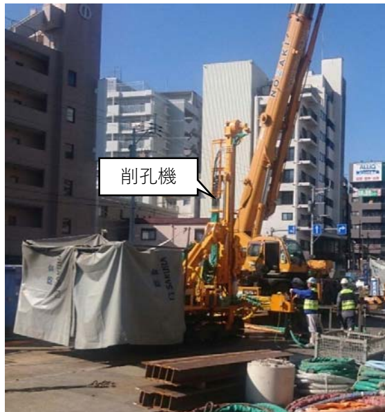
地盤改良工(削孔状況)