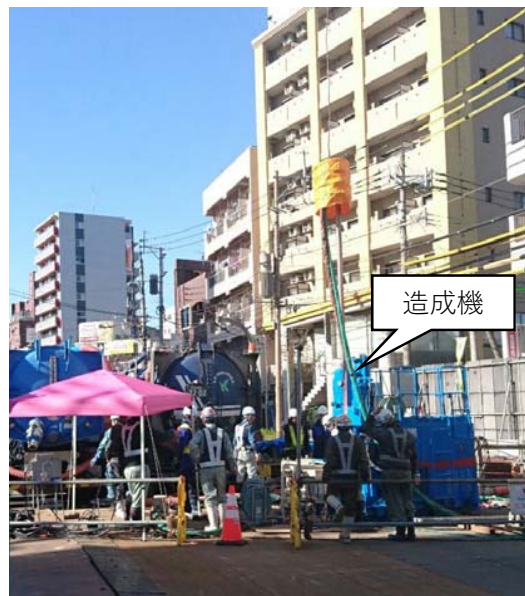
地盤改良工(造成状況)