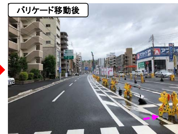
緊急車両通行対策