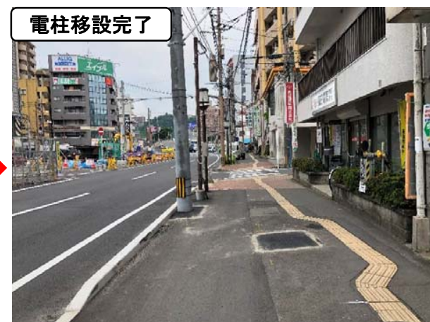
歩道スペースの改善