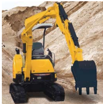
バックホウイメージ写真