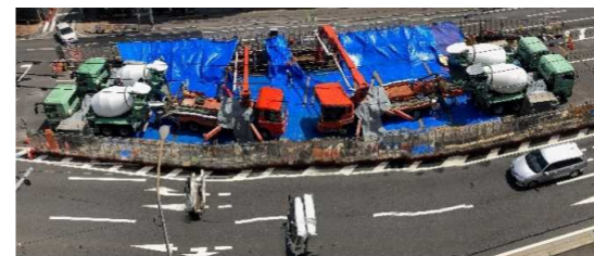
立坑底版コンクリート打設状況