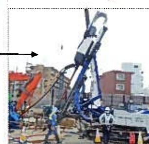
斜め施工用地盤改良機 (イメージ)