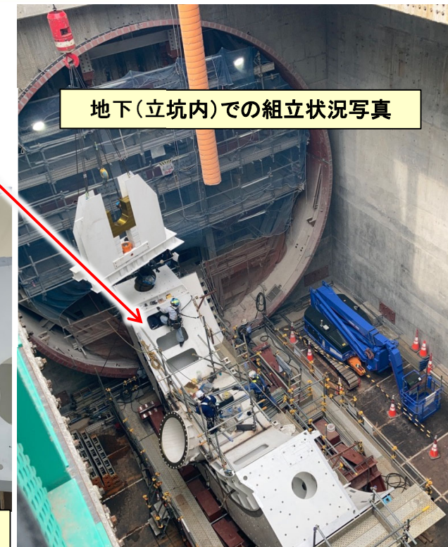
地下(立坑内)での組立状況写真