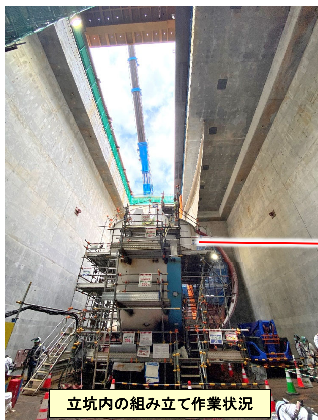
立坑内の組み立て作業状況

※インフォメーションセンターにて、立坑内での 組立状況をライブ映像でもご覧頂けます。