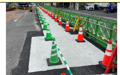
北側歩道橋の基礎杭撤去状況(曙陸橋)