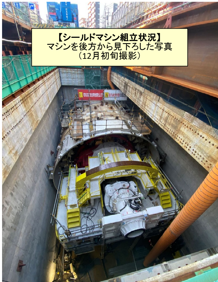
【シールドマシン組立状況】 マシンを後方から見下ろした写真 (12月初旬撮影)

シールドマシン(トンネルの掘削と壁の設置を同時に行う機械)は、地下(立坑)での大型部品の組み立てをほぼ完了いたしました。 それに伴い、地上の大型クレーン等の解体を行います。(下図参照) シールドマシンは、今後、配線・配管を含む小型部品の設置や各種調整などを来年6月頃までかけて行っていきます。