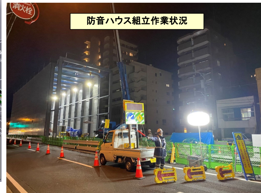
防音ハウス組立作業状況

11/14から防音ハウスの組み立て工事(夜間作業)が始まりました。詳細については先月号をご参照下さい。