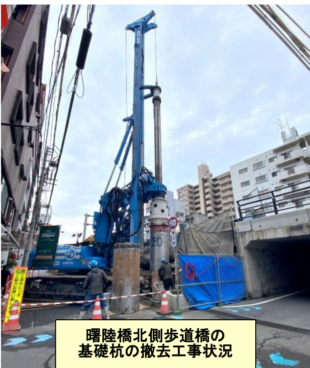
曙陸橋北側歩道橋の 基礎杭の撤去工事状況