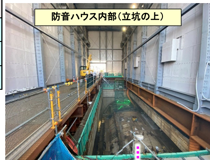
防音ハウス内部(立坑の上)

今後掘削するトンネルと、曙陸橋の北側歩道橋の基礎杭が干渉することから、安全に掘削するため事前に歩道橋(杭含む)の撤去を行っています。 大成・大豊JVによる杭撤去工事は2月末で完了致しますが、今後(3月以降)、JR敷地内にかかる部分の歩道橋撤去工事がJRにより施工されます。