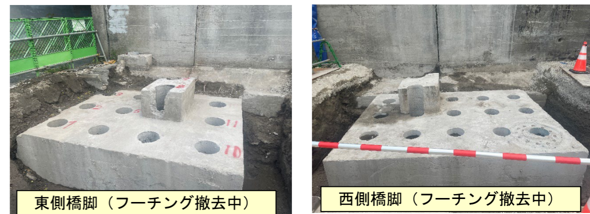
▲9月中に橋脚フーチング(上写真)を撤去し、改良土で埋め戻します。