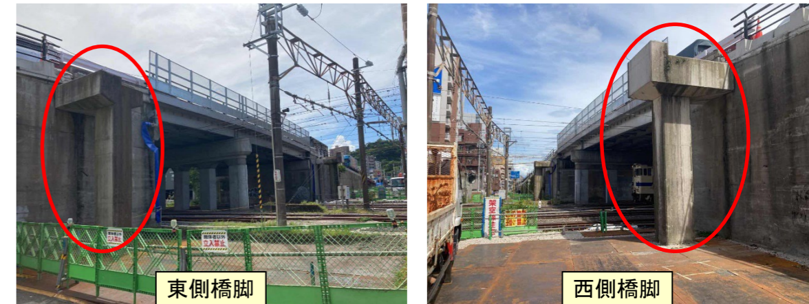
▲撤去している歩道橋の橋脚