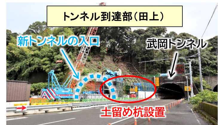
トンネル到達部(田上)