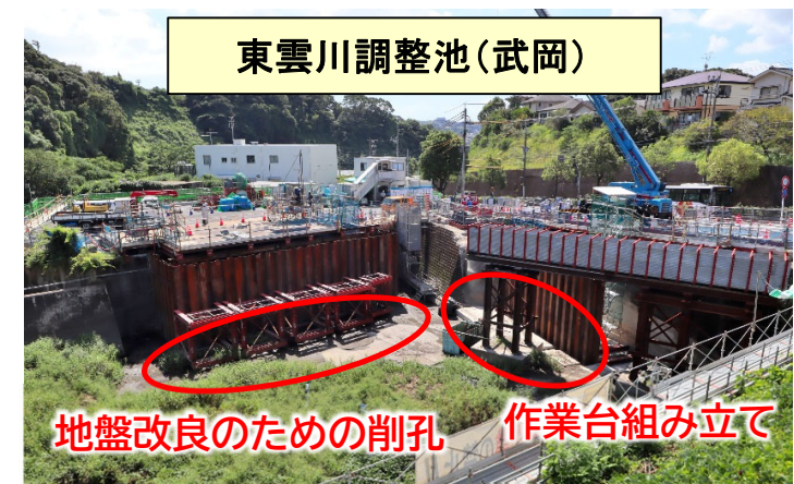
東雲川調整池(武岡)

○これまでシールドマシンの組立など掘削に向けた準備を進めてまいりましたが、地域の皆様及び関係者のご協力により、2023年11月より、田上IC側に向かってシールドマシンが発進する見込みとなりました。