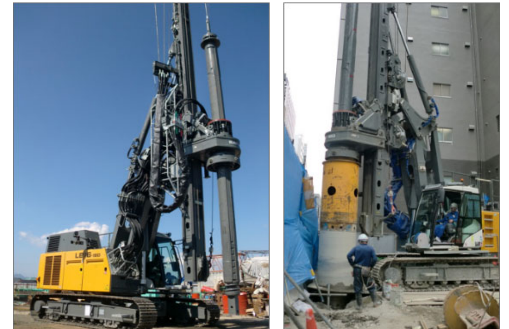
▲配置する杭抜機の参考写真