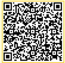
鹿児島東西道路 工事説明会資料

当日使用しました工事説明会の資料は、鹿児島国道事務所ホームページ(右のQRコード)や、インフォメーションセンターにてご覧いただくことができます。 説明会の議事概要につきましても、鹿児島国道事務所ホームページに掲載しています。