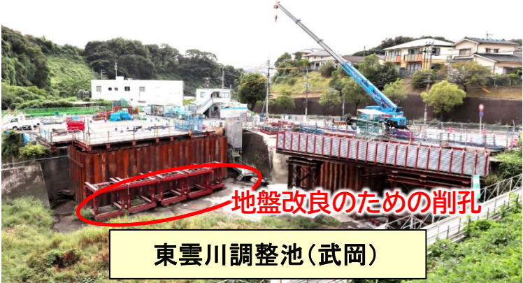
東雲川調整池(武岡)