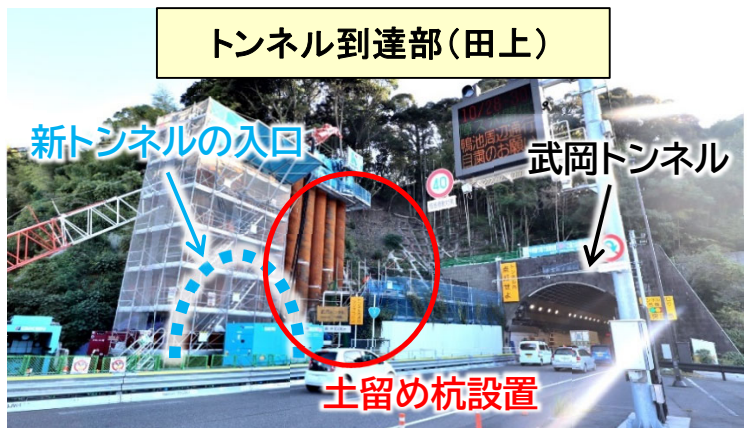
トンネル到達部(田上)