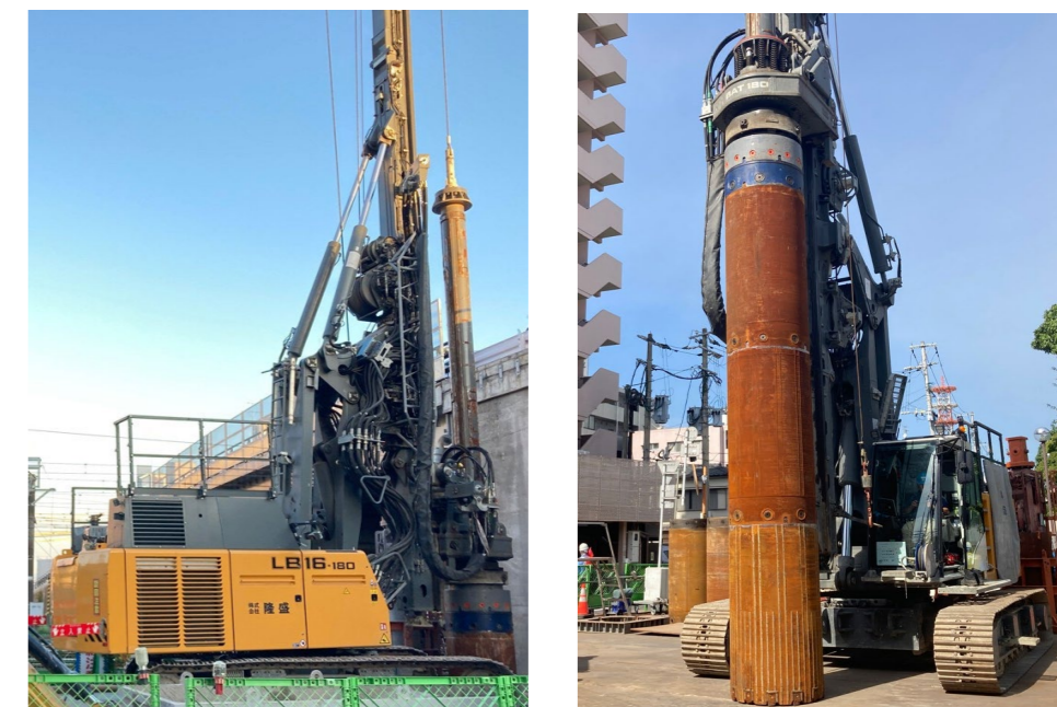
▲杭抜機の写真(西側)