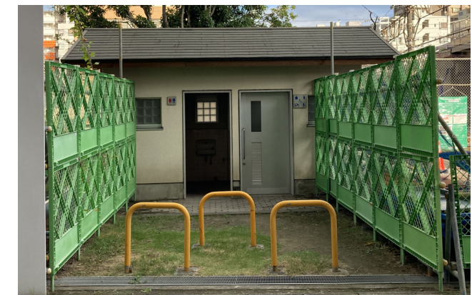
* 武公園トイレは引き続きご利用頂けます。