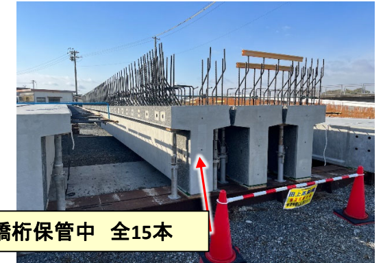
工場において、橋桁保管中 全15本