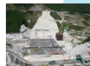
平成19年9月 本体コンクリート打設直前