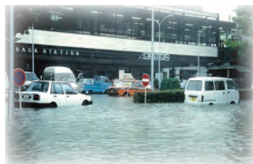
平成2年7月洪水(佐賀市)