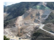
平成18年3月 基礎掘削工事