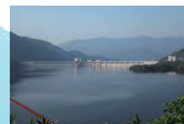
平成23年8月 試験湛水中