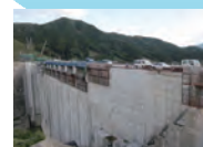
平成22年10月 本体工事中