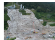
平成19年6月 基礎掘削工事