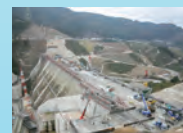
平成21年3月 本体工事中