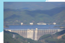
平成23年11月 試験湛水中(洪水時最高水位)