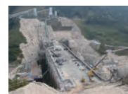
平成20年11月 本体工事中