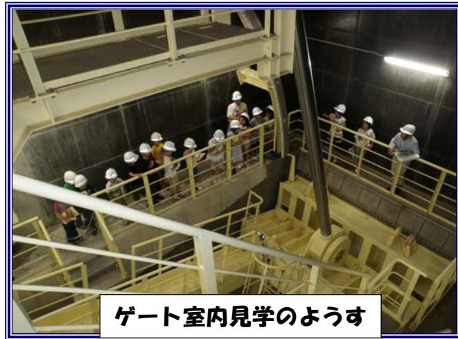
ゲート室内見学の様子