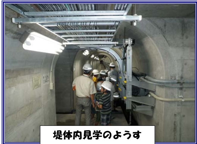
堤体内見学の様子

※一般公開では、日頃は見ることが出来ない ダムの中 （監査路やゲート室）を見ることが出来ます！！