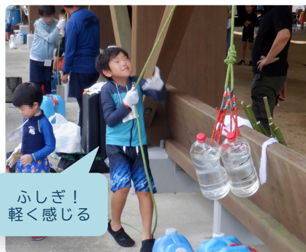
ロープと滑車でこどももパワーアップ