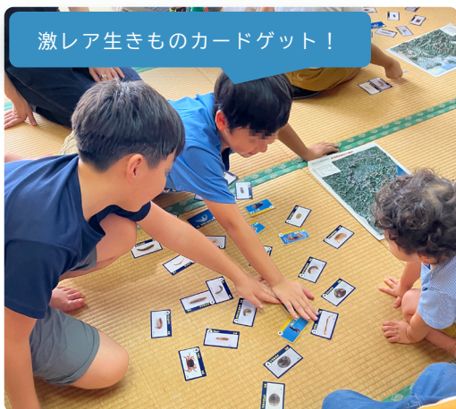
激レア生きものカードゲット!