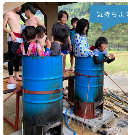
ドラム缶お風呂もサイコーです♪