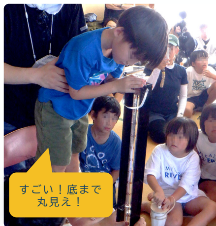
すごい! 底まで丸見え!