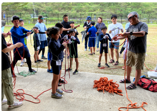
まずはロープの使い方をプロから学ぶ