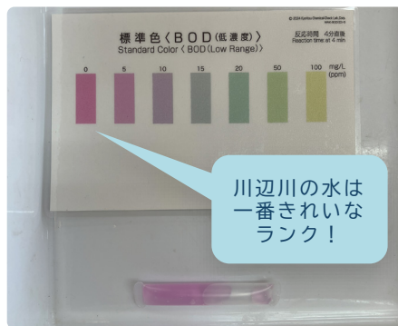
パックテストで川辺川の水質実験