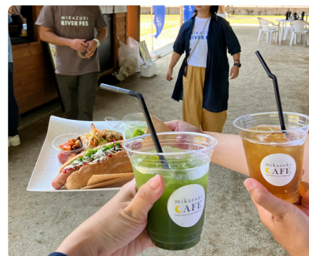
手作りの川辺川流域の恵みランチ