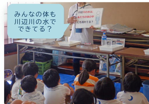
川辺川クイズに挑戦!