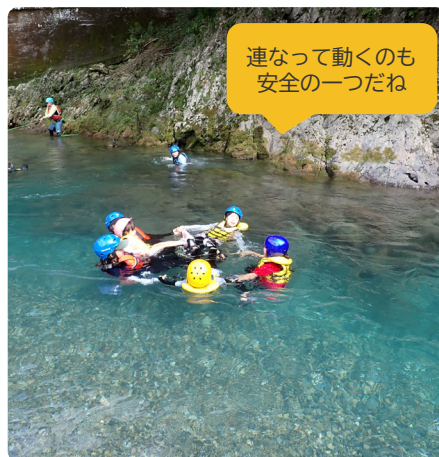
みんなで一緒に安全に川流れを楽しもう