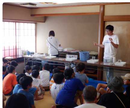
川の実験のおさらい