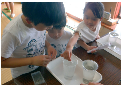
アメンボが水に浮くしくみ実験