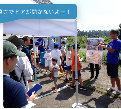
災害から命を守る方法を学ぶ