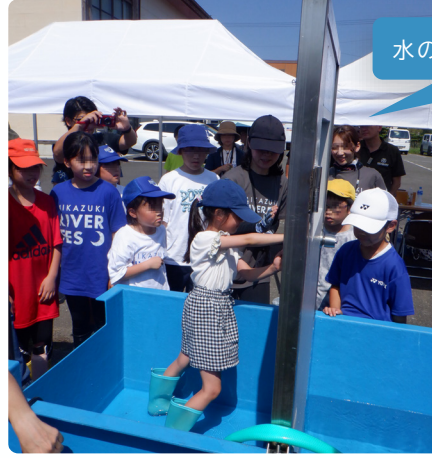
水の重さでドアが開かないよー!