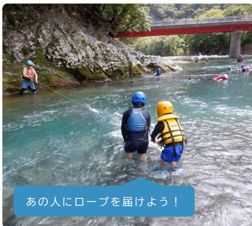
実際にロープを投げてレスキューに挑戦