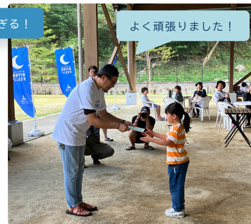
見事ミッション達成！修了証授与式