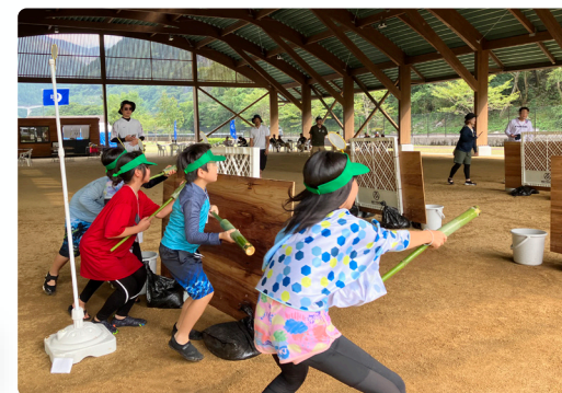
自分で作った竹の水鉄砲でバトル開始！