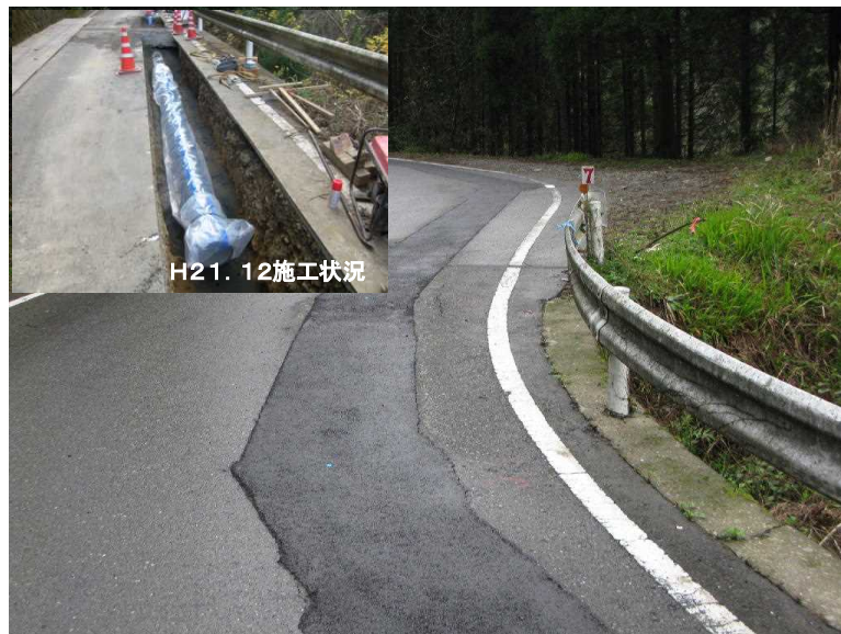
II 元井谷水源からの導水管敷設状況 (H25.3完成)