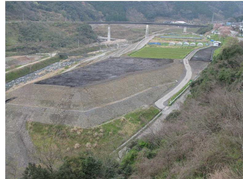
III 代替農地整備状況 (高野地区・H22.3概成)