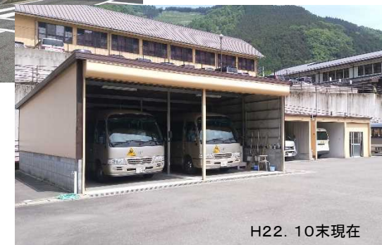
IV スクールバス車庫・消防署移転状況 (H22.10完了)