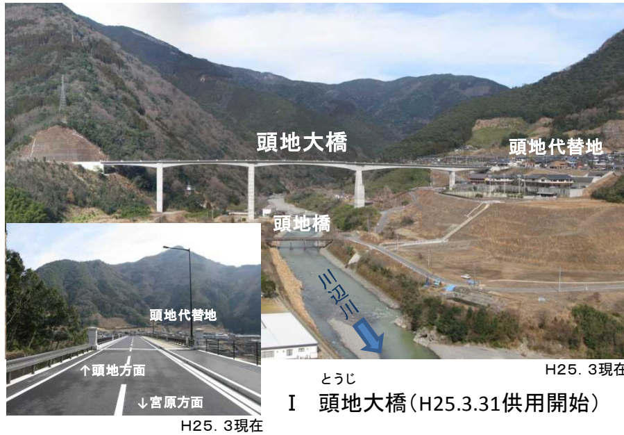
I 頭地大橋 (H25.3.31供用開始)