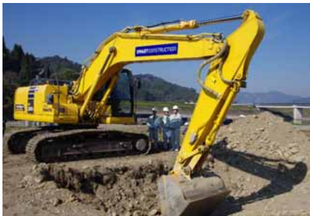
ICT現場での実習（BH操作体験）