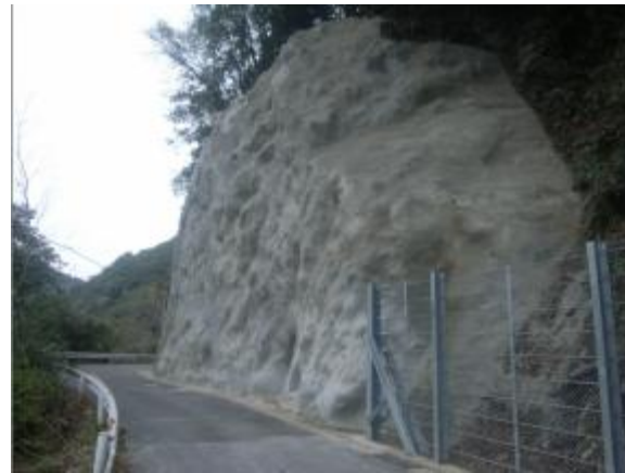
④ブロック積補修(旧国道445号)