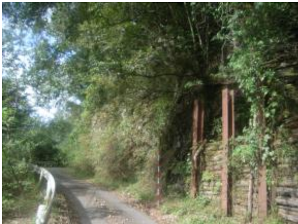
③モルタル吹付(旧国道445号)