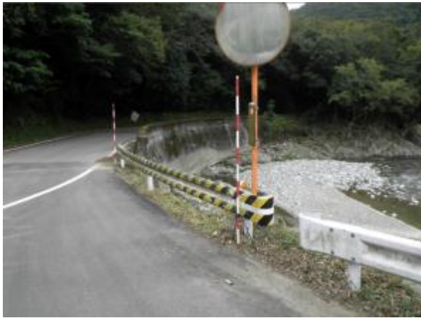
⑤ガードレール交換、根継ぎ工事(旧県道宮原五木線)