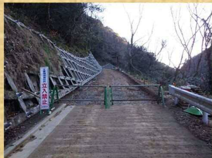
工事用道路起点側より撮影