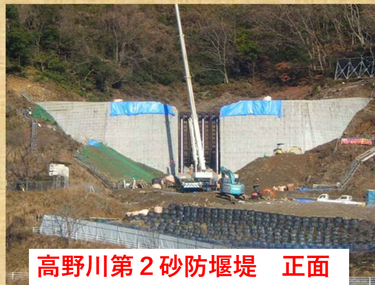
高野川第2砂防堰堤 正面