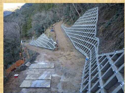
工事用道路終点側撮影