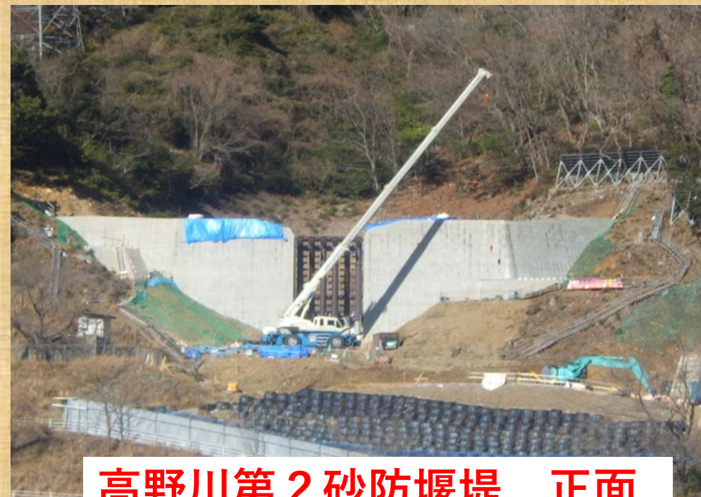
高野川第2砂防堰堤 正面