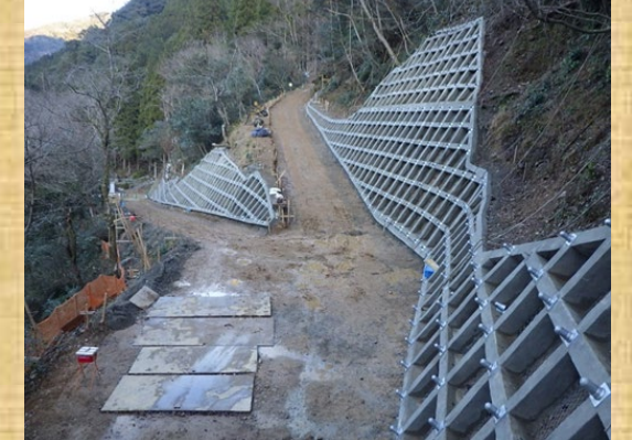
工事用道路終点側より撮影