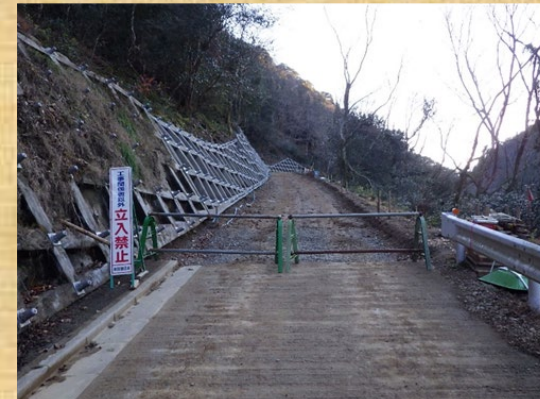
工事用道路起点側より撮影