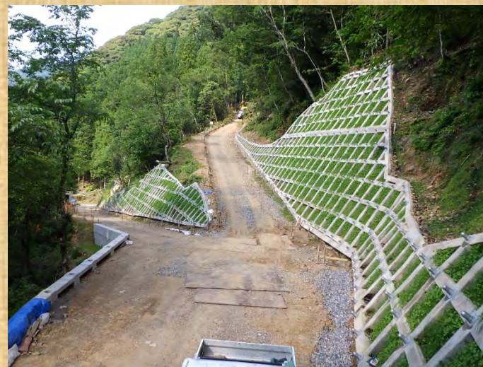
工事用道路終点側撮影