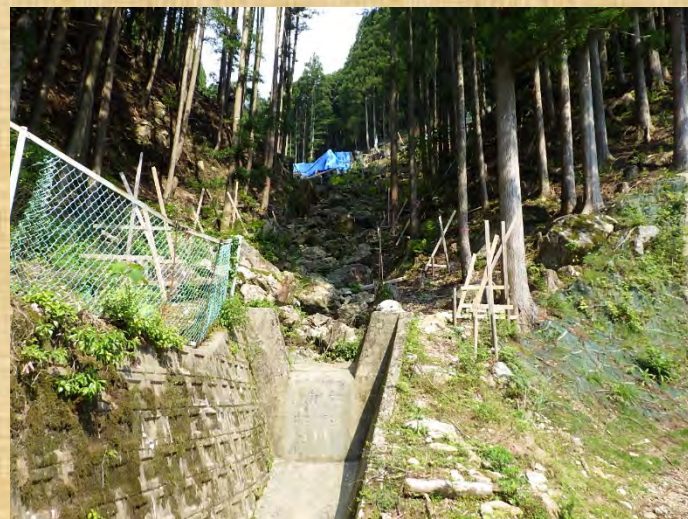
砂防堰堤下流側より撮影