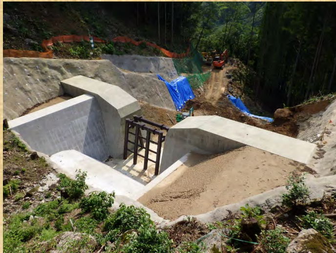
砂防堰堤上流側より撮影

工事名：築切砂防堰堤（二期）工事 工期：令和2年5月1日～令和3年6月30日 施工業者：株式会社 技建日本