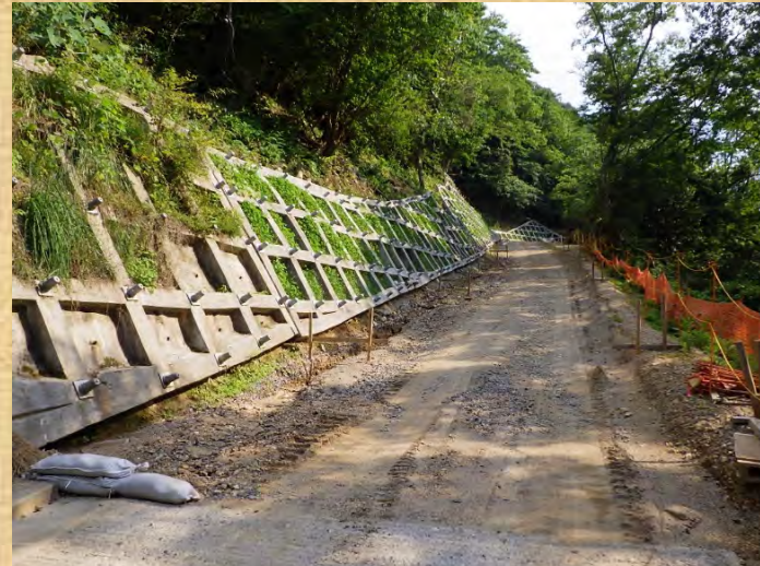
工事用道路起点側より撮影