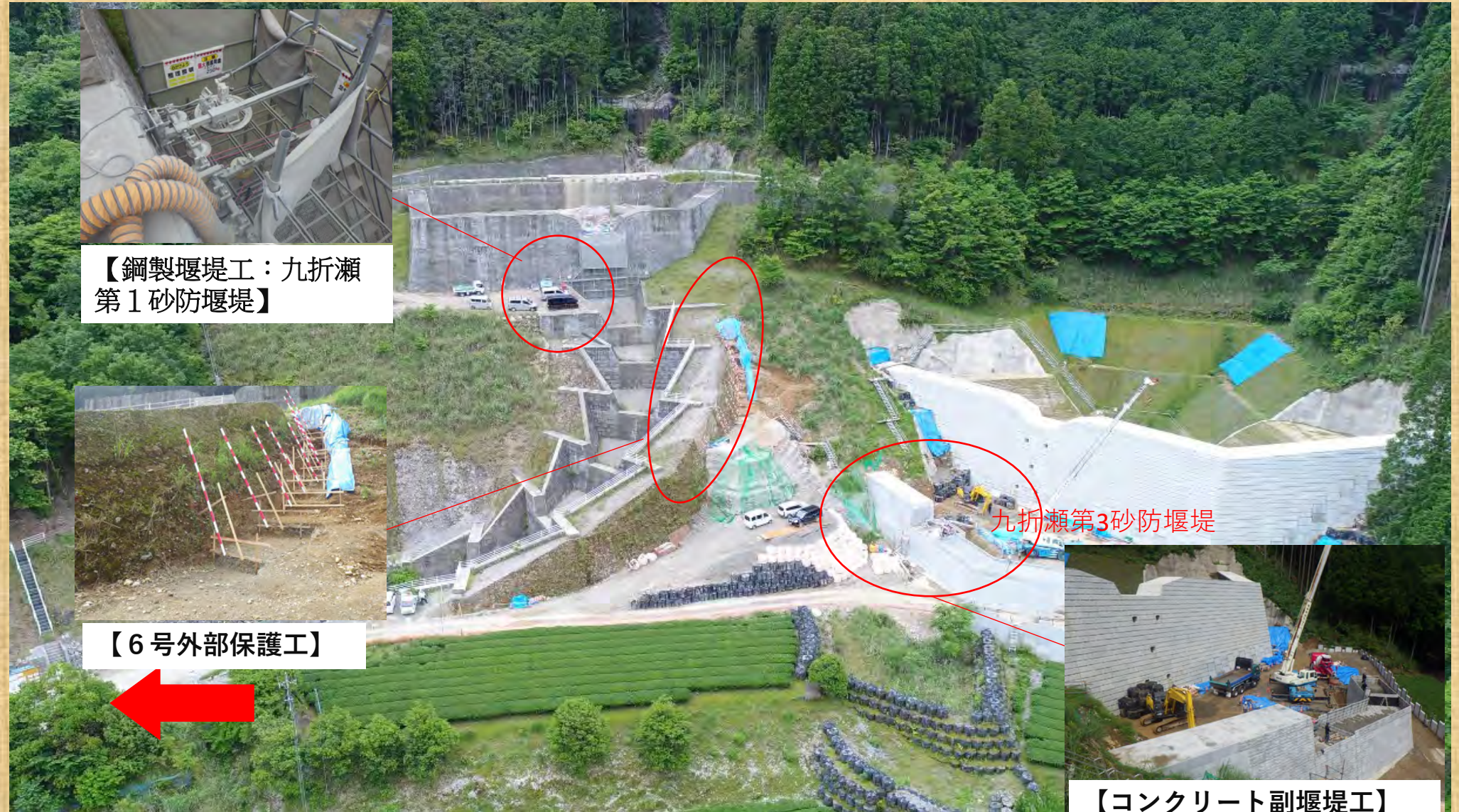
【鋼製堰堤工：九折瀬第1砂防堰堤】