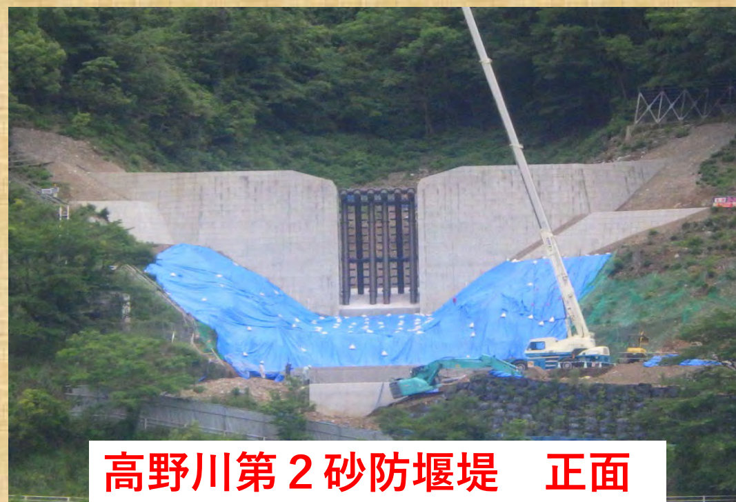
高野川第2砂防堰堤 正面