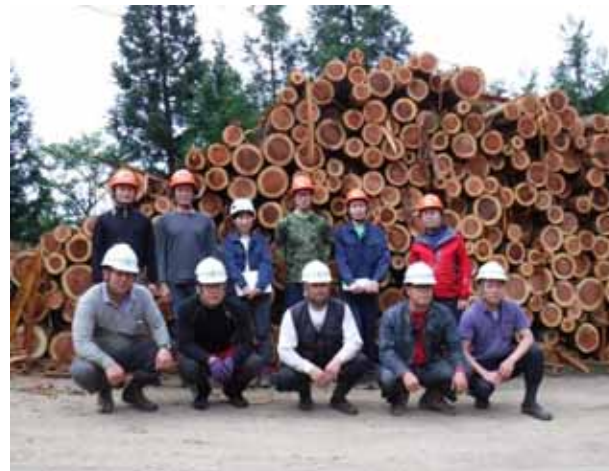
県南校の生徒(後列) 6名