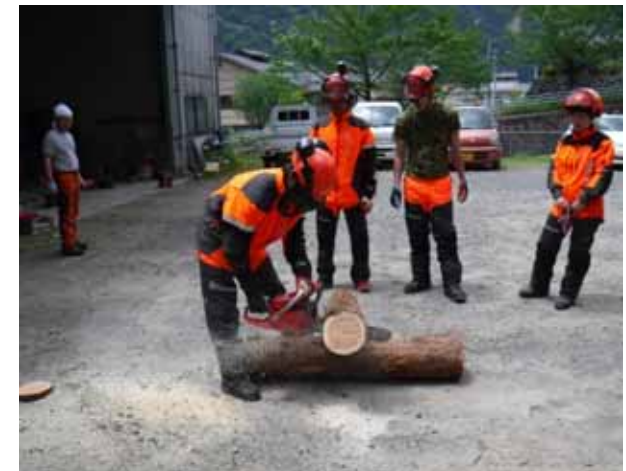
チェーンソーの操作法など現地実習の実施(150日間)