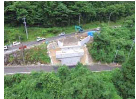
施工中(橋台取付工:左岸側)