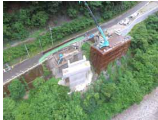
施工中(橋台取付工:右岸側)