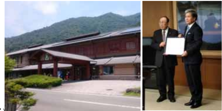
熊本県と五木村との運営に関する協定締結 (平成30年12月17日)