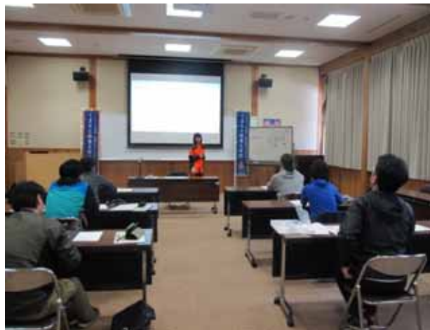
五木村役場を中心に座学を実施(50日間)