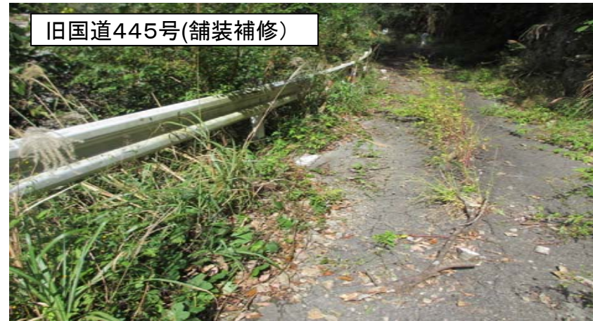
旧国道445号(舗装補修)