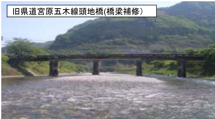
旧県道宮原五木線頭地橋(橋梁補修)