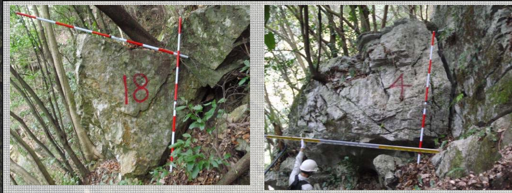
法面上部の転石状況