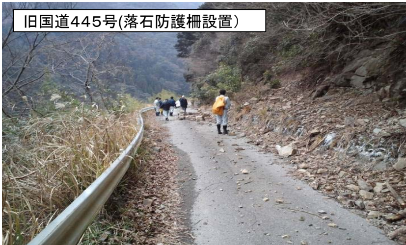
旧国道445号(落石防護柵設置)