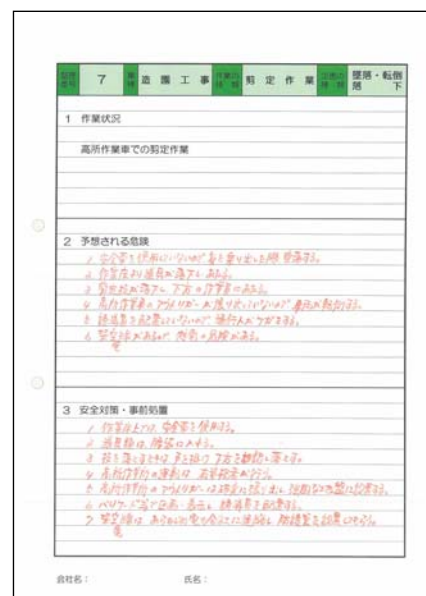
【危険予知訓練(KYK)危険予知シート】 *一人一人に発表してもらい全員で意見交換を行った結果を記入。