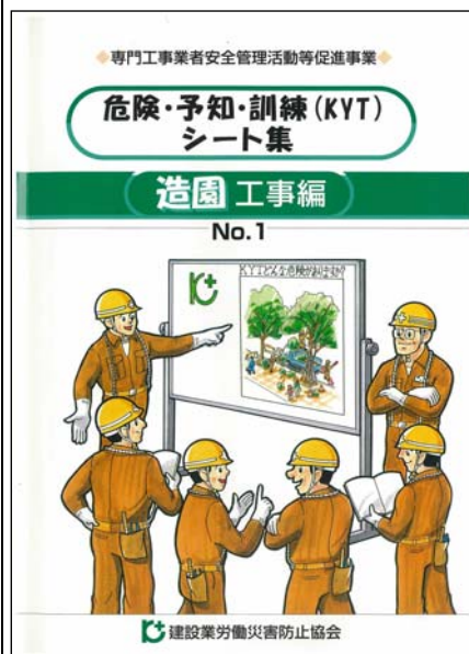
【危険予知訓練(KYK)問題集】