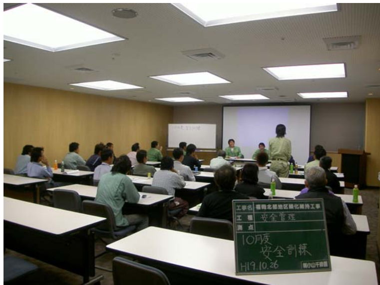
*安全訓練・教育の実地風景(一人一人に発表してもらおう)