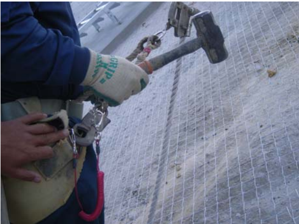
使用工具落下防止装置装着状況