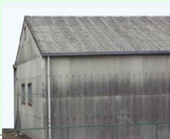
④アスベスト含有建材