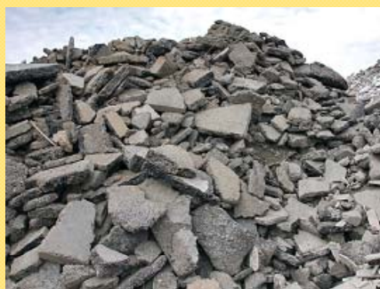
③アスファルト・コンクリート塊