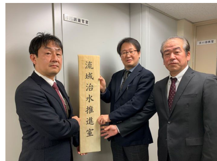
写真：流域治水推進室長（中央）と副室長（両端）