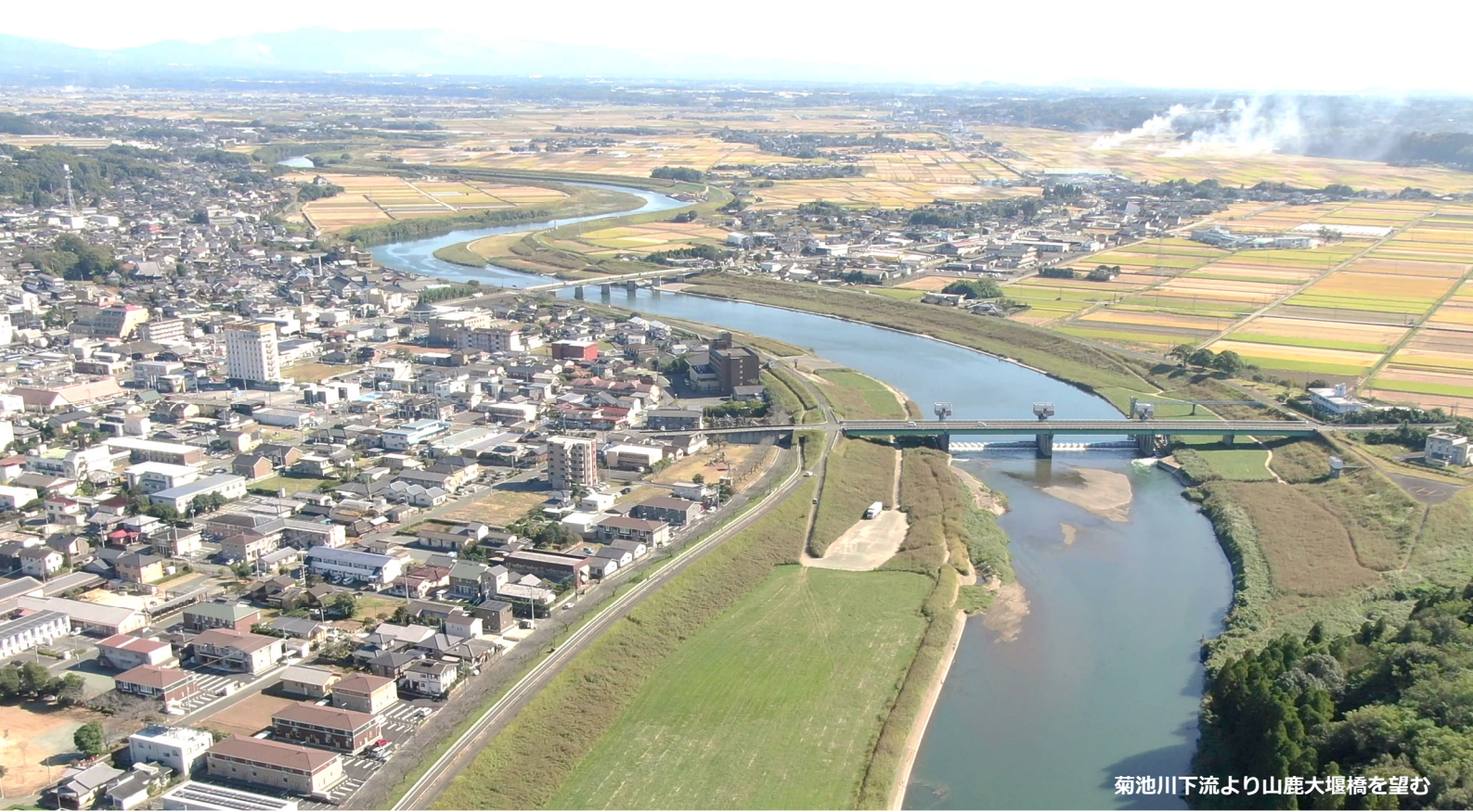
菊池川下流より山鹿大堰橋を望む