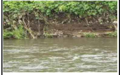
通常時、洪水後の河川の変化