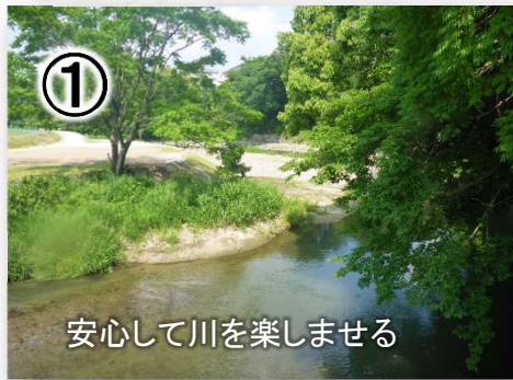
安心して川を楽しませる