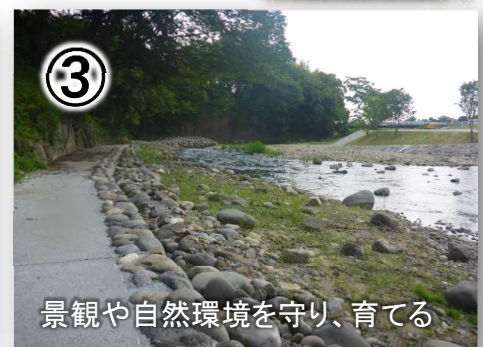
景観や自然環境を守り、育てる