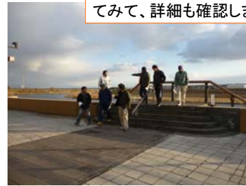
実際に、イベント会場に行ってみて、詳細も確認します。