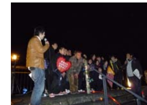
鹿本高校のみなさんは、今年退職される校長先生に熱い愛を伝えました！