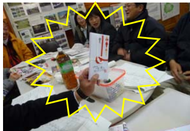
大賞賞品はなんと、豪華温泉旅行に決定！！