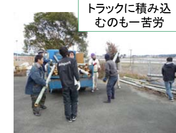
トラックに積み込むのも苦労