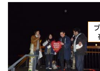
プロポーズの言葉も夜空に響きました