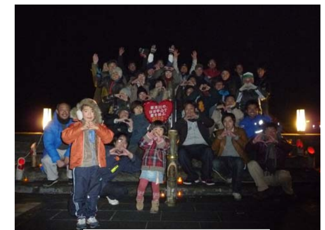
みなさん、おつかれさまでした！！