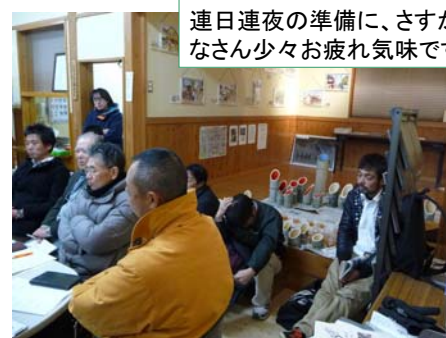
連日連夜の準備に、さすがにみなさん少々お疲れ気味です