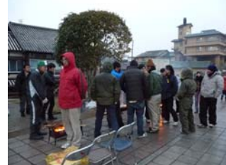
中止の一報が入り騒然とする現場…