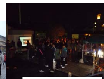
天気もなんとかもって、30分遅れでスタート