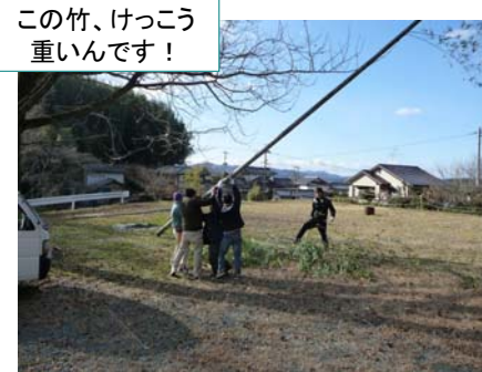
この竹、けっこう重いです！

2月に行われるイベント『百華百彩』に向けての準備を行いました。『百華百彩』を彩る「竹灯籠」の材料となる竹の切り出しを約半日かけて行ったあと、打ち合わせ、竹灯籠の試作などを行い、大忙しの日でした。