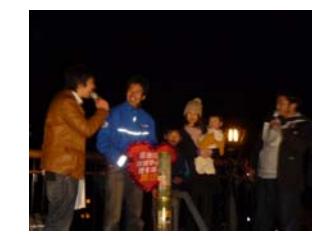
おいしいところをゲット！