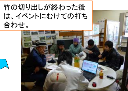
竹の切り出しが終わった後は、イベントにむけての打ち合わせ。