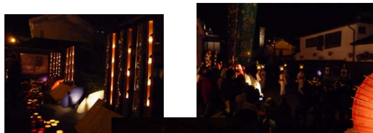
百華百彩のオープニングセレモニー

いよいよ『百華百彩』開幕です。この日、定例会が行われ『百華百彩』の最終日に行われる『ほぼチュウ』に向けての最終打ち合わせを行いました。