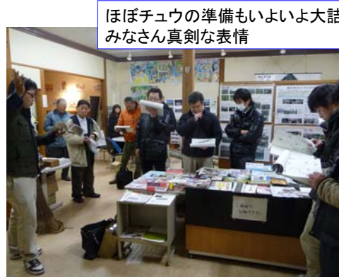
ほぼチュウの準備もいよいよ大詰め、みなさん真剣な表情