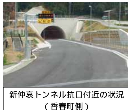
新仲哀トンネル抗口付近の状況 (香春町側)