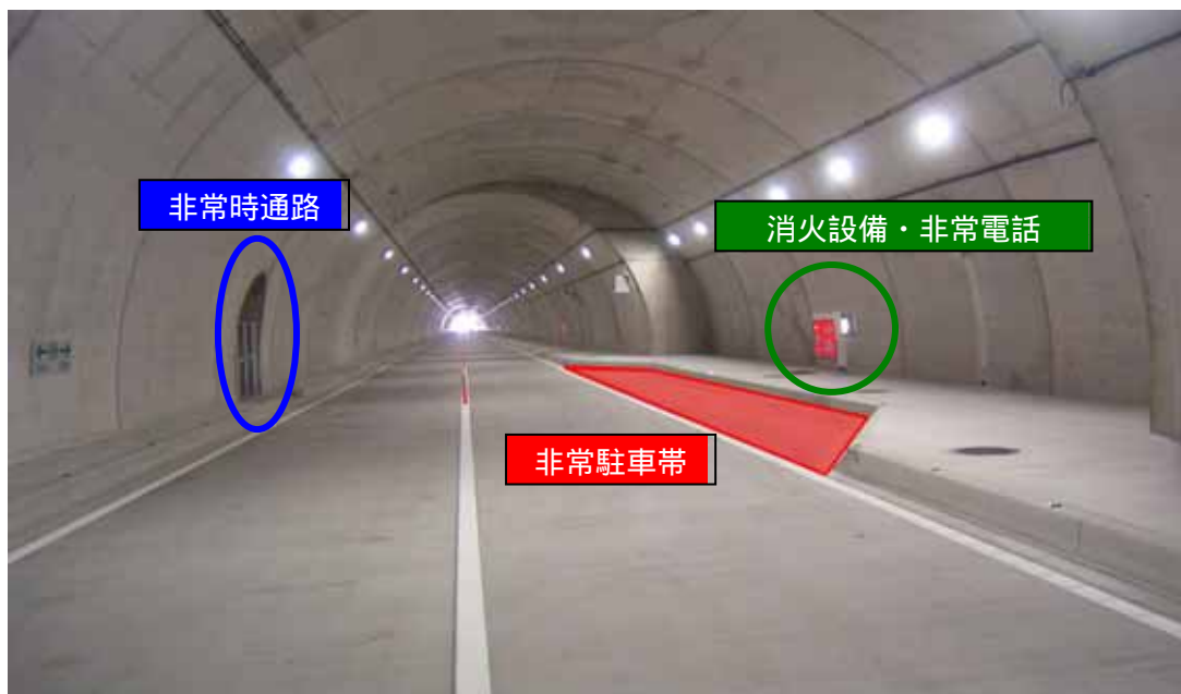
新仲哀トンネル内非常用施設の状況