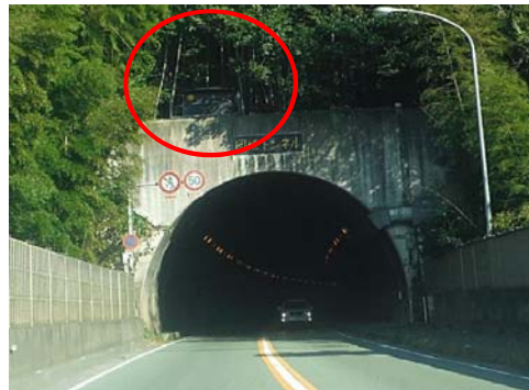
▲岡垣トンネル坑口