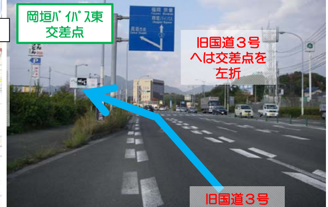
▼城山峠交差点から北九州側を望む