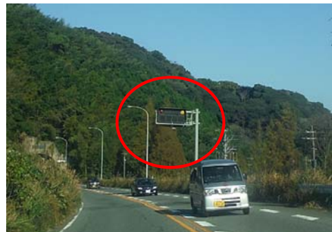
▲城山トンネル(福岡側)