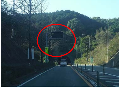
▲岡垣トンネル(北九州側)