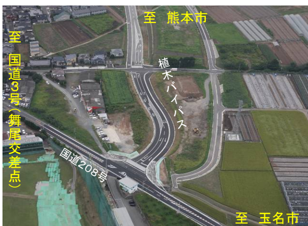
植木バイパス、国道208号接続交差点【H22.9撮影】