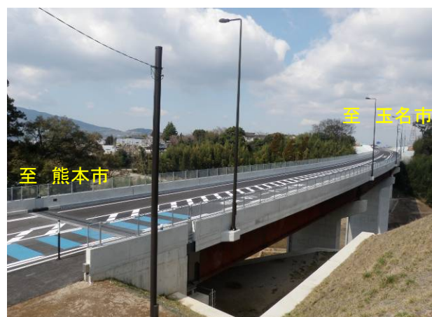
植木大橋(橋長=199.4m)【H23.3撮影】