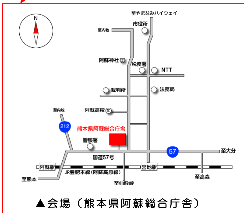
▲ 会場（熊本県阿蘇総合庁舎）