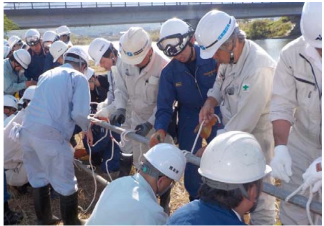
水質事故対策訓練 実技講習 (イメージ)