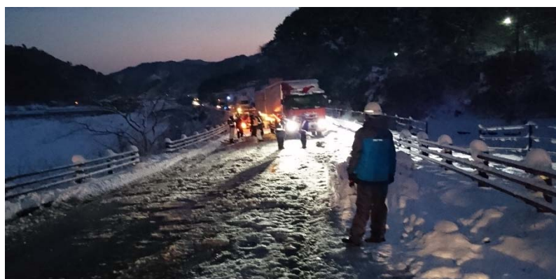
国道3号 (赤松～佐敷間) H28.1月