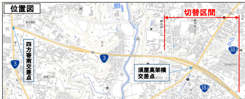
現況(切替前) (令和4年9月29日まで)