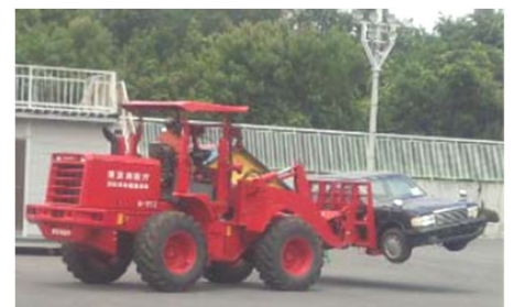
車両移動のための具体的方策 (例:ホイールローダーによる移動)