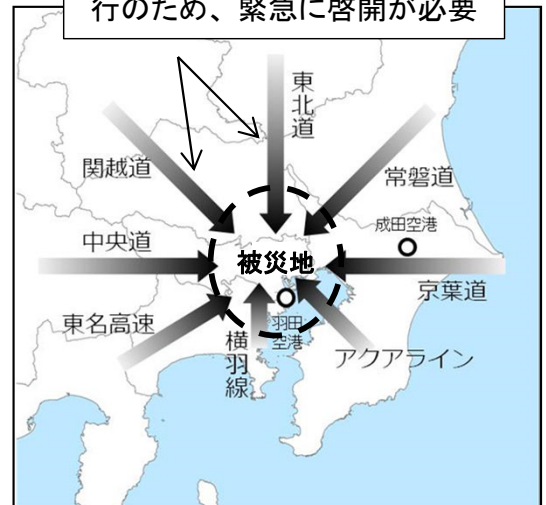
(首都直下地震における八方向作戦の例)