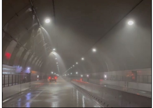
<トンネル 消火設備点検>