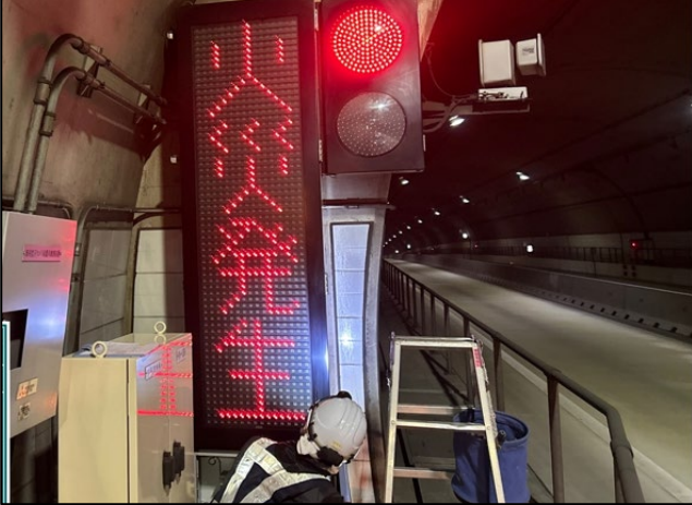
<トンネル 非常用装置点検>