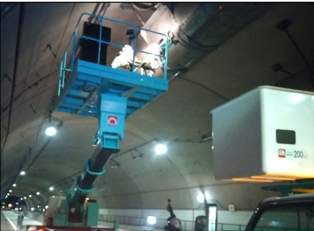
<トンネル ジェットファン点検>