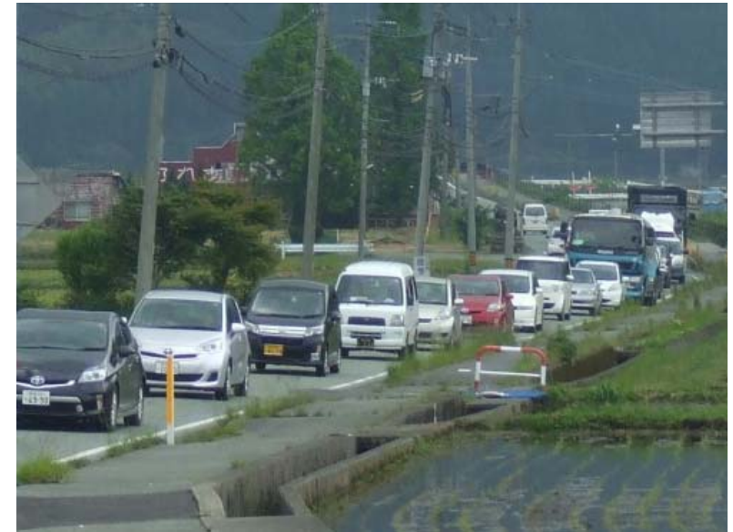
写真① 県道菊池赤水線渋滞状況