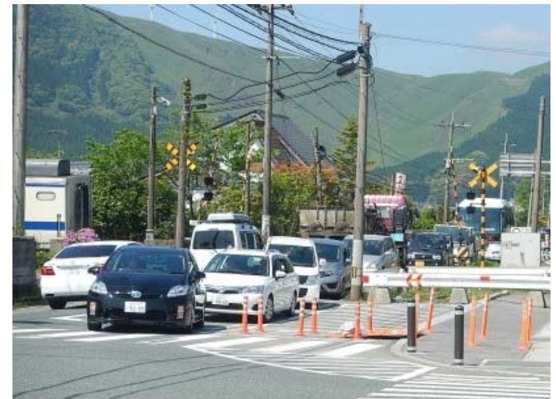
写真② ミルクロード入口交差点渋滞状況