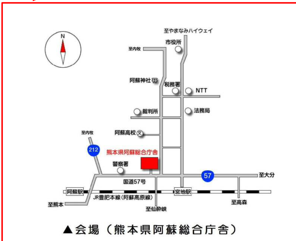
▲ 会場（熊本県阿蘇総合庁舎）