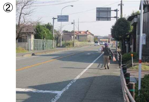
▲整備前の歩行者の通行状況(国道3号)