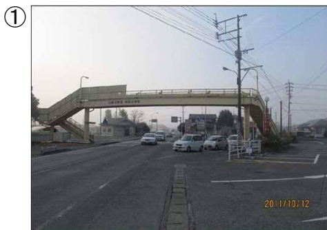
▲整備前の交差点状況